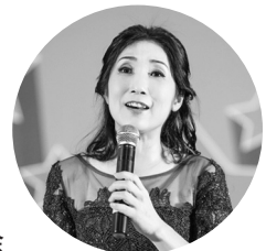
韓 昕 余

你是罪 你是罪人 在我生命裡奔跑的愛呀 你帶來的 如你一樣的 如你河流般的雙手 一去不回頭